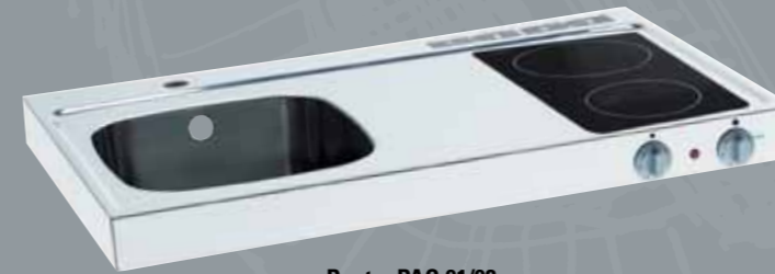
Pantry PAG 91/92