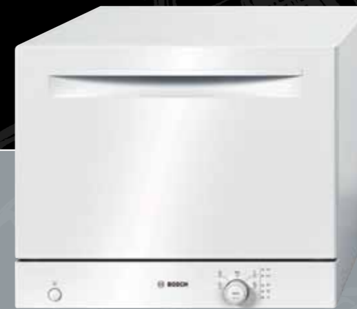
Geschirrspüler BOSCH B 551 x H 450 x T 500 mm