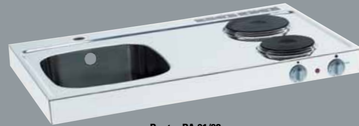
Pantry PA 91/92

Die Lieferung erfolgt inkl. Ab- und Überlaufgarnitur.