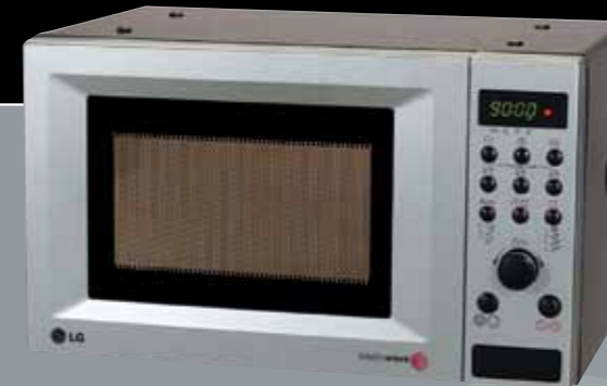
Mikrowelle LG B 455 x H 281 x T 313 mm

Unser Augenmerk gilt natürlich nicht nur dem durchdachten Design unserer Küchen. Wir wissen, dass keine Küche der Welt was wert ist, wenn die Funktion nicht erfüllt ist. Deshalb verwenden wir ausnahmslos getestete Elektrogeräte führender Markenhersteller.