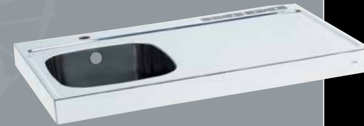
Pantry PAT 91/92