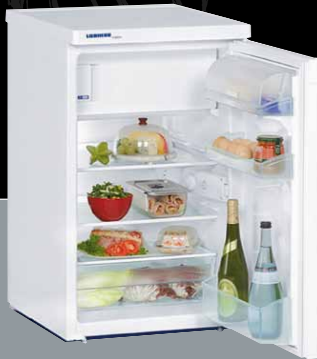
Kühlschrank UKS 1434 LIEBHERR B 501 x H 820 x T 610 mm