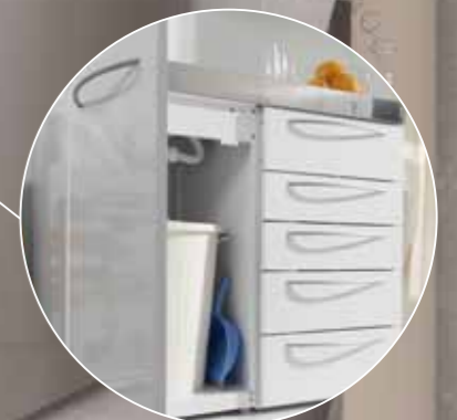
Viel Platz für Stauraum