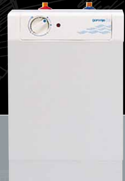
Elektro Warmwasserspeicher B 255 x H 375 x T 210 mm