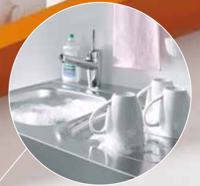
Spülbecken aus Edelstahl