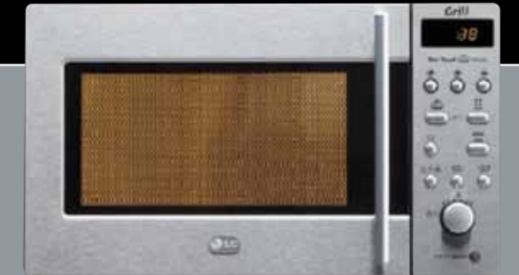
Mikrowelle LG B 455 x H 281 x T 325 mm